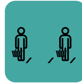
Limitahan ang dami ng mga customer