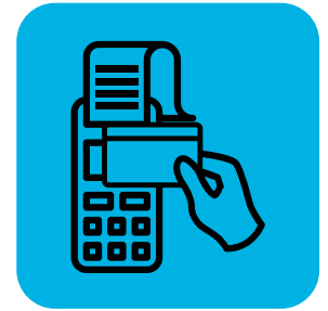
Limitahan ang pakikipag-ugnayan sa mga customer