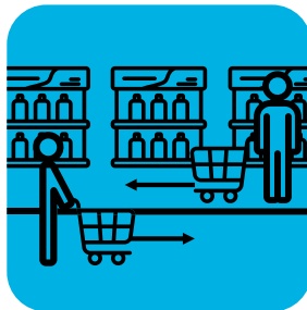
Markahan ang sahig para paglayuin ang mga customer