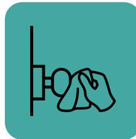
Linisin ang mga lugar o bagay na madalas hinahawakan