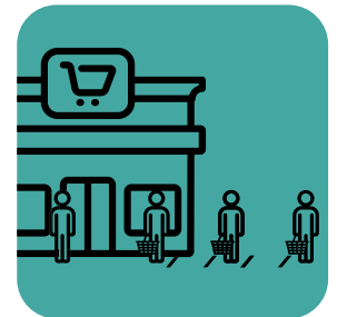
Magtalaga ng staff na magpapanatili ng distansya