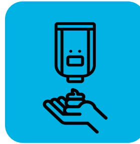
Maglaan ng hand sanitizer para sa mga taong nagdedeliver at mga customer