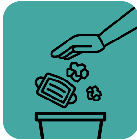
Maglagay ng ligtas na pagtatapunan ng mga wipes, pantakip sa bibig at ilong, at gwantes