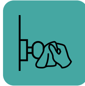
વારંવાર સ્પર્શ થતી સપાટીઓને સાફ કરો