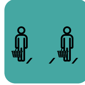
ગ્રાહકોની સંખ્યા મર્યાદિત કરો