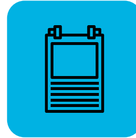
કર્મચારીઓ માટે સલામતીના નિયમો જાહેર કરો